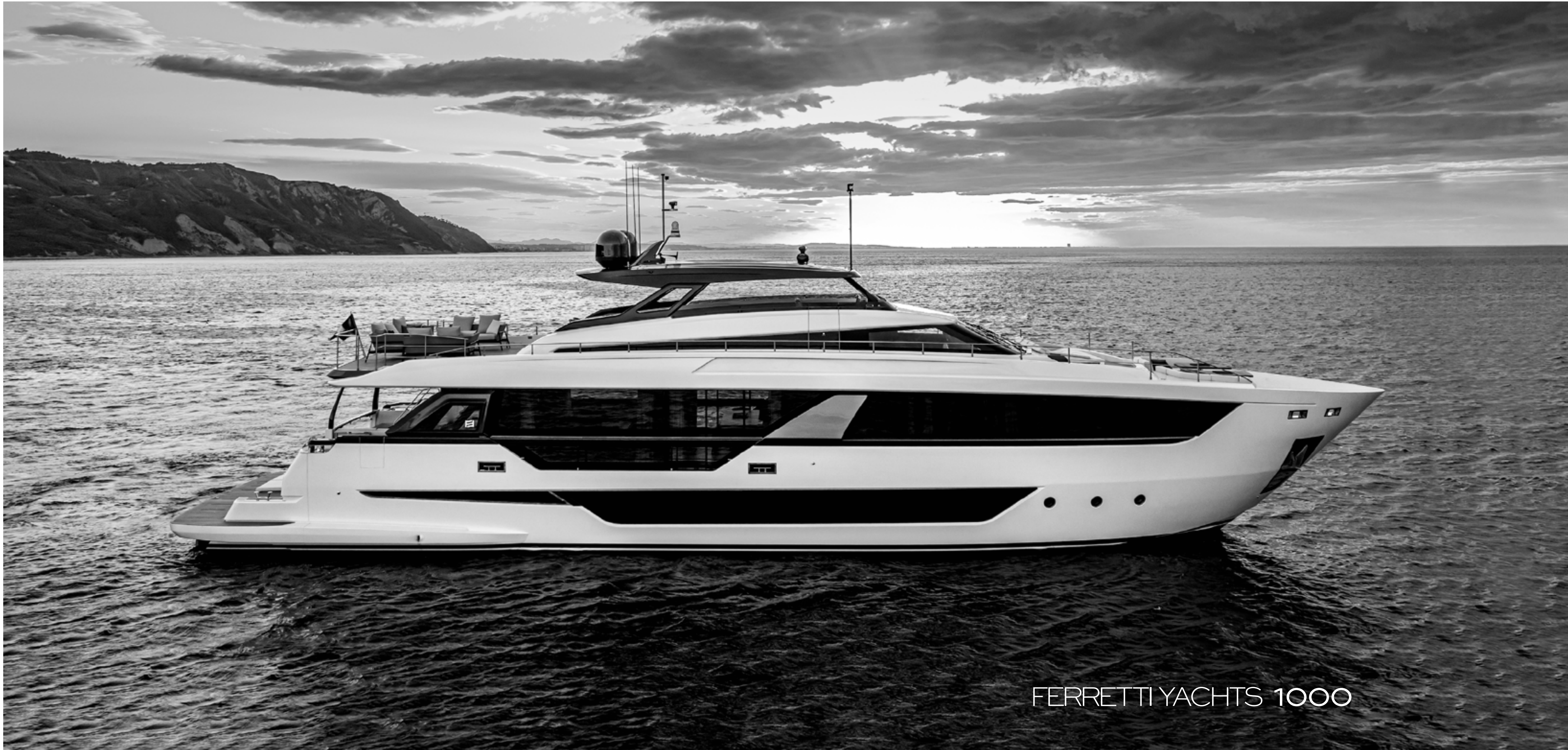
FERRETTI YACHTS 1000