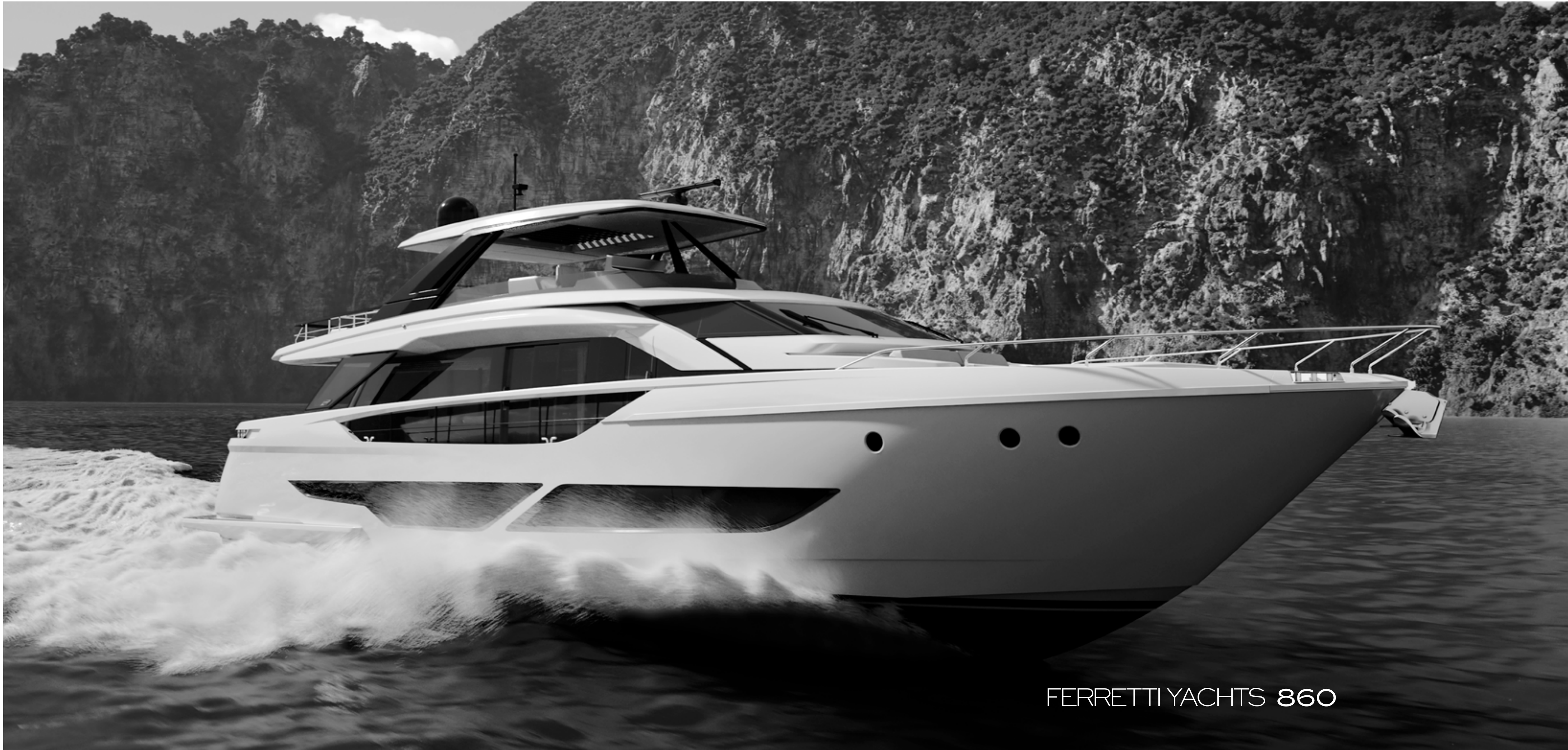
FERRETTI YACHTS 860